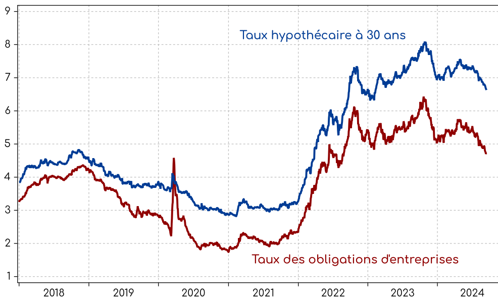
Dorval Asset Management - 13/09/2024

En Europe, la BCE explique que les conditions financières restent restrictives, et que sa politique de baisse des taux vise à réduire cette pression négative. Certains pans de l'économie sont certes déjà un peu soulagés par la baisse des rendements obligataires, mais le crédit bancaire reste dominant dans le financement de l'économie de la zone euro. En juillet 2024, l'enquête de la BCE auprès des banques avait déjà montré que l'évolution des taux d'intérêt ne déprimait presque plus la demande de crédit (graphique 4). On peut supposer que les statistiques d'octobre montreront une poursuite de l'amélioration récente, et même que la demande de crédit se reprenne, comme l'ont déjà indiqué certaines banques européennes dans leur communication au cours des dernières semaines.